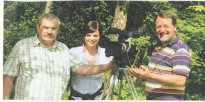
Der Dokumentarfilm über die Ostgoten in Kärnten feiert am 1. Juli in Klagenfurt Österreichpremiere